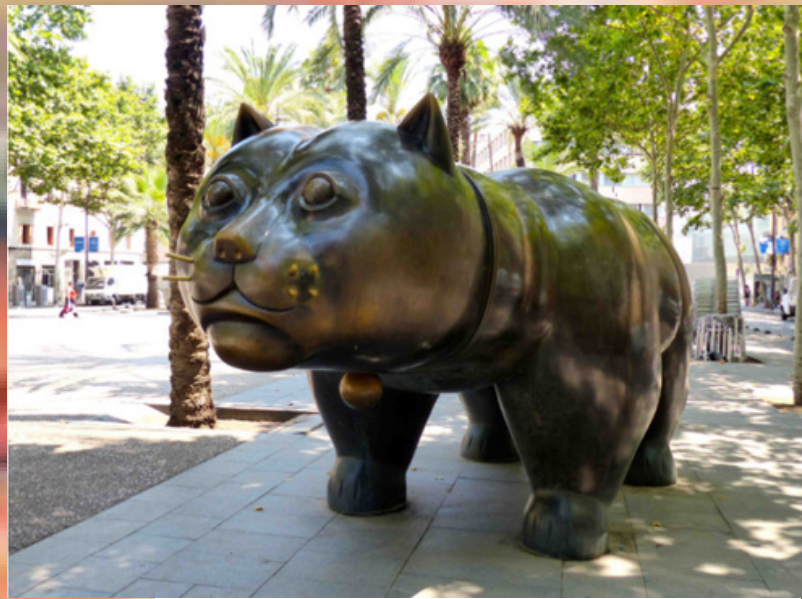
El gato (gordo) de Fernando Botero

Fernando Botero Angulo ( Medellín , 19 de abril de 1932- Montecarlo , 15 de septiembre de 2023) fue un artista , pintor, escultor y dibujante figurativo colombiano